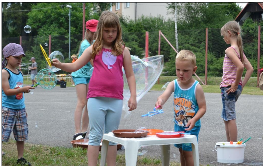
Dětský den 2018