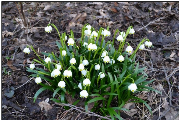
Bledule jarní, Ve Březí, 27. března 2021