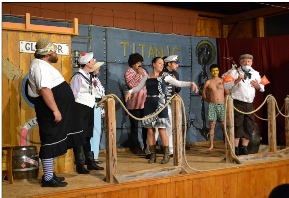
Z divadelního představení Pravda o zkáze Titaniku, 10. října 2020

Vážení spoluobčané, chalupáři a příznivci obce Peřimov,