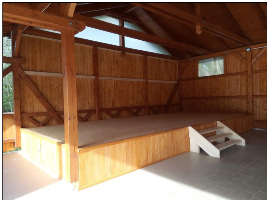
Rekonstruovaný most přes Olšinu u čp. 85 a nové pódium u Klubu.