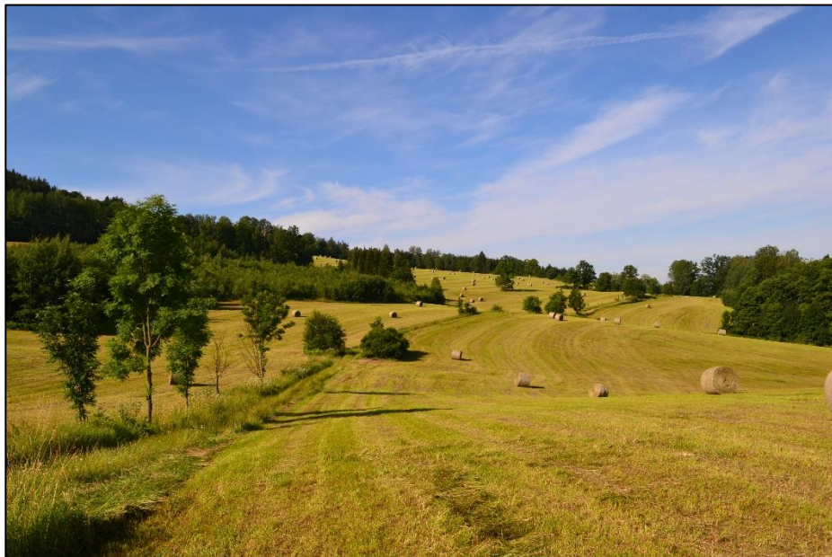
Peřimov mezi Strážníkem a Vápenkou, 15. července 2020

Vážení spoluobčané, chalupáři a příznivci obce Peřimov,