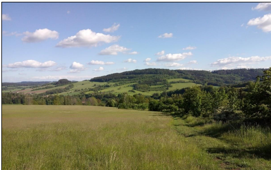
Peřimovský Strážník z Hájů nad Jizerou, 26. května 2020