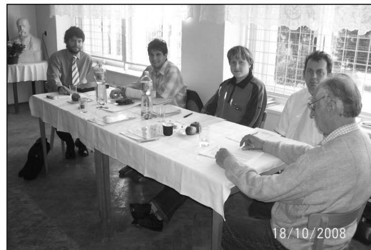
Volební komise 2008

ODS si tedy i v letošních volbách udržela v Peřimově první příčku, ale pouze velice těsně, oproti výsledkům z roku 2004 ztratila šest hlasů. Na druhou příčku se posunula celkově vítězná ČSSD, která naopak získala o 5 hlasů víc. Přibližně stabilní podporu si udržela KDU-ČSL kandidující letos v koalici pro Liberecký kraj, ale do krajského zastupitelstva se nedostala ani tentokrát. Komunisté posílili o šest hlasů. Za zmínku stojí poměrně velká podpora regionálního seskupení Starostů pro Liberecký kraj a také Národních socialistů, za které kandidoval Ing. V. Jiříšta. Celkově lze tedy říct, že v letošních volbách posílila u nás i na celostátní úrovni zejména levice.