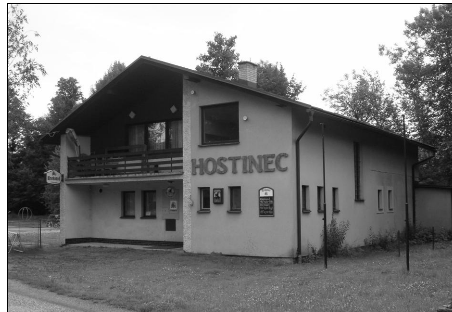
Zrekonstruovaná klubovna – viz rozhovor na poslední straně

Vážení a milí peřimovští občané, rekreatanti a všichni příznivci naší obce. Chtěla bych Vám nejprve v čase krásného léta, dovolených a prázdnin popřát hodně sluníčka, klidu a pohody. Zároveň Vás chci v krátkosti seznámit s tím, co se dělá a co se ještě letos dělat bude.