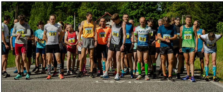
Na startu Desítky, 22. 5. 2022

Děkujeme všem organizátorům za bezproblémový průběh celé akce, která dělá Peřimovu výbornou pověst i za hranicí našeho regionu.