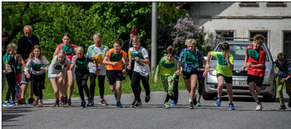
Start dětské kategorie závodu na 1 km, 22. května 2022

Vážení spoluobčané, chalupáři a příznivci obce Peřimov,