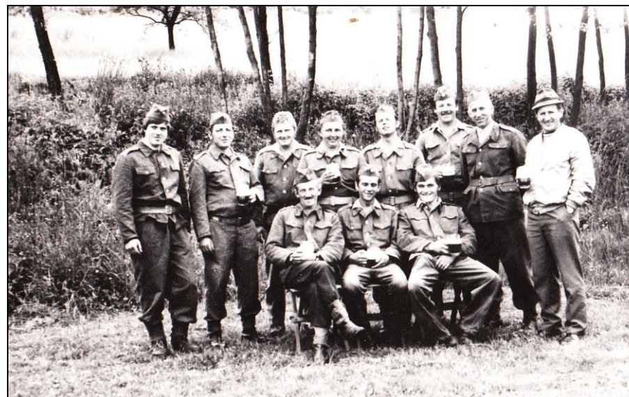
Poznáte je? Jedna z mála dochovaných fotografií předních členů SDH, rok i autor neznámý ...

Sbor dobrovolných hasičů byl založen roku 1890 a v letošním roce tedy oslaví 115 let svého trvání. To je už samo o sobě dostatečným důvodem k ohlédnutí se za jeho historii.