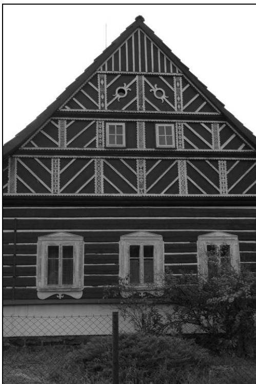
Bohatě vyřezávaná lomenice na Vodseďálkově chalupě č.p. 88. Obdobná celostránková fotografie se objevila v červnovém čísle časopisu Krkonoše.