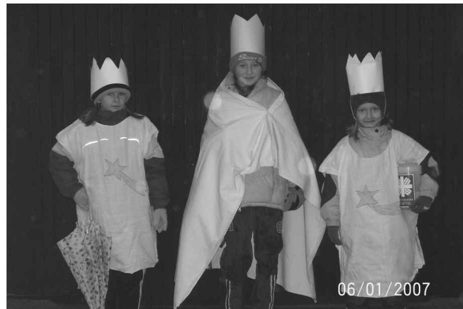
My tři králové jdeme k Vám...