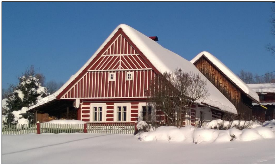
Zima 2017 (čp. 18)