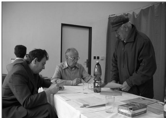
Volby 2006 v Peřimově, foto Z. Jiříštová, 4/2006

Každý člověk má ve stáří nárok na odpočinek. Byl jsem zastáncem ponechání okresních úřadů a nezřizování krajů, neb se jedná jen o další úřednická místa. Tomu nefandím a práce pak přestává člověka bavit.