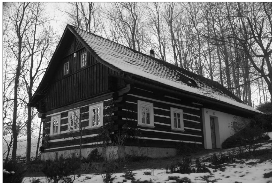
Chalupa čp. 126, foto V. Jiříšta 2005

Zpracováno s využitím údajů z Programu obnovy venkova, 4/1999