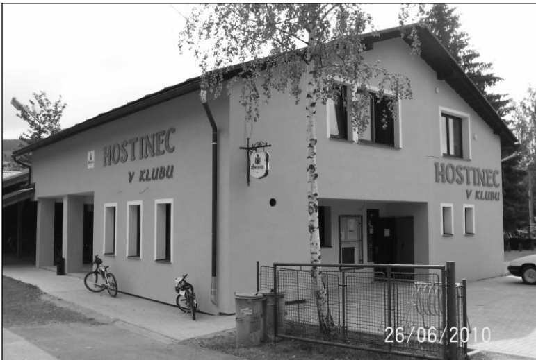
Nová podoba hostince, 2/2010