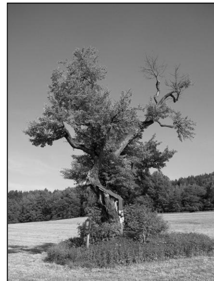
Památná hrušeň, foto V. Jiříšta 2005