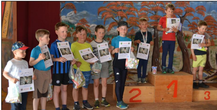
Účastníci Peřimovské desítky – chlapci, běh na 1 km