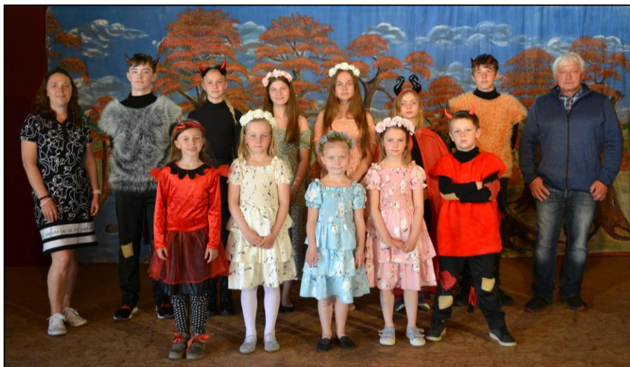
Herci a režiséri dětského divadla Na Peříčku, 22. 5. 2023

Vážení spoluobčané, chalupáři a příznivci obce Peřimov, máme za sebou polovinu roku 2023, letní prázdniny jsou v běhu, a proto vám přinášíme trochu střípků z naší činnosti.