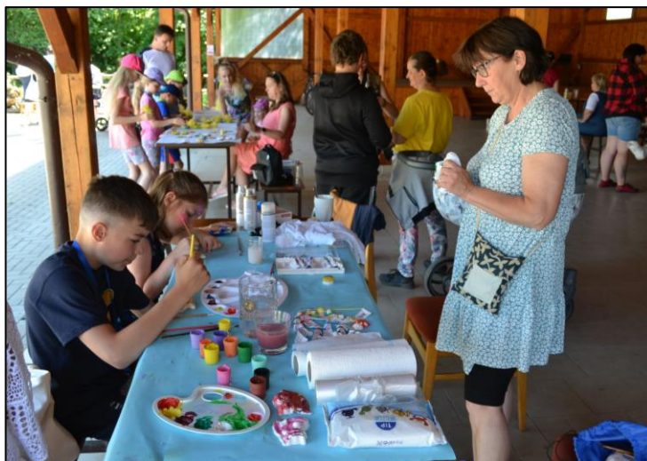
Dětský den 2023

Zpravodaj OÚ Peřimov, tel.: 481 543 264, obec.perimov@tiscali.cz, www.obecperimov.cz Uzávěrka 19. 7. 2023, počet výtisků 165, neoznačené texty a fotografie Mojmir Zemánek.