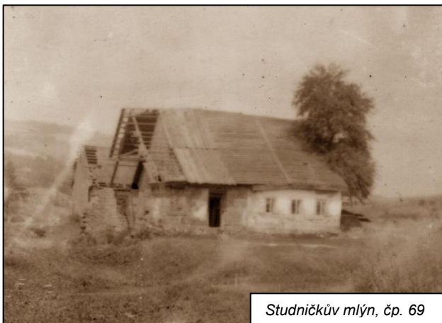
Studničkův mlýn, čp. 69

výročí užívání mostu, což by zasloužilo malou oslavu. Letos to už asi nestihneme, ale starostové Peřimova, Mříčného, Loukova, Hájů a Dolní Sytové si na letošní oslavě v Dolní Sytové slíbili, že se