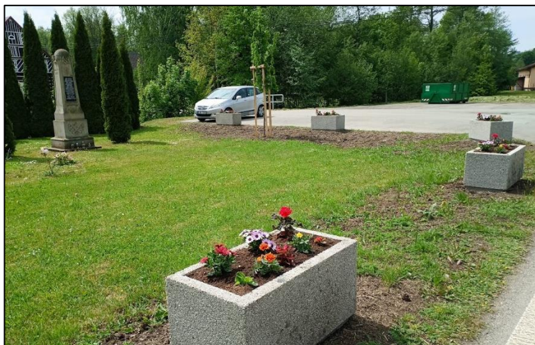
Nově upravené prostranství před OÚ

Více informací na: poutkolemperimova.peo.cz